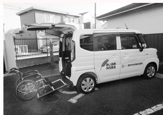
＜スズキ・スペーシア＞