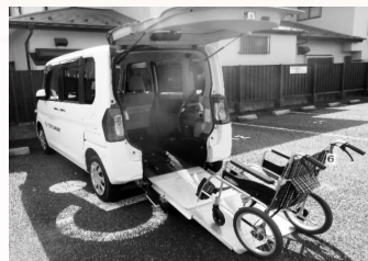
＜ダイハツ・タント＞