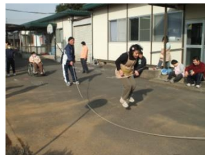
ボール・なわとび