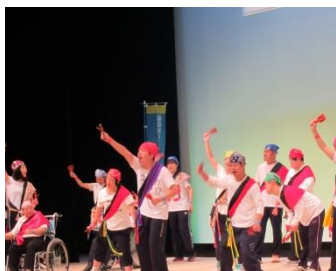
やさしいいきいきフェスティバルで演技発表