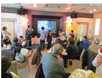
保護者との交流会