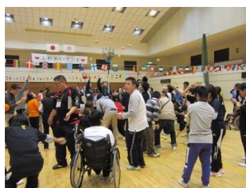
ふれあいランド参加