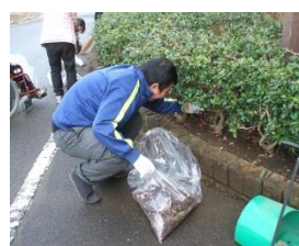
公共施設の環境整備